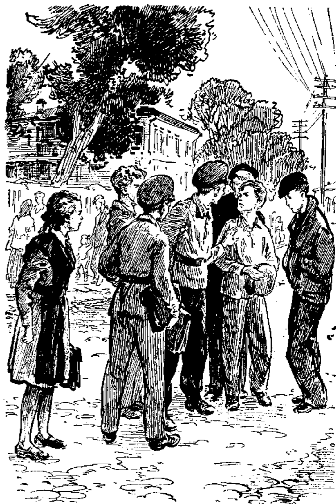
К нам подошли двое ребят — те самые, что когда-то били меня возле манежа.