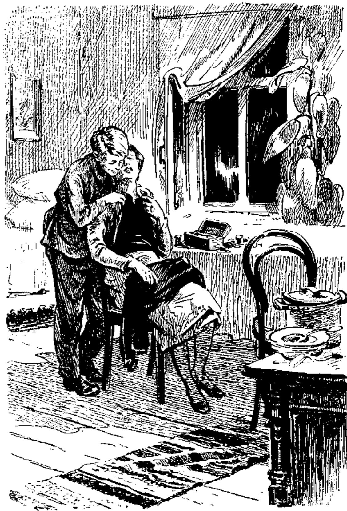
Не знаю, сколько времени мы молчали.

Мать сидела за столом с шитьем в руках и подозрительно спросила, где я был и хочу ли есть.