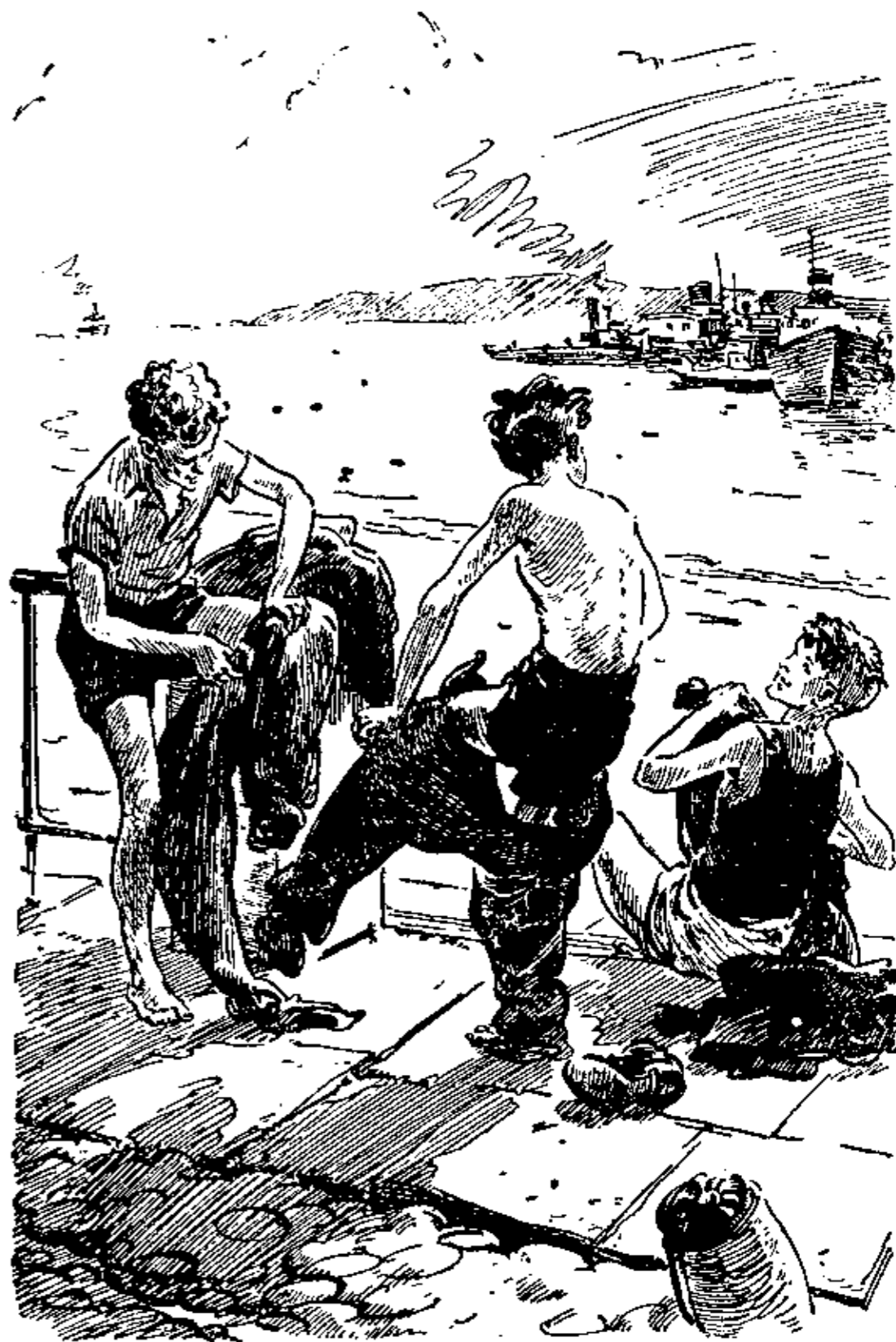
На их брюках оказались такие же, как и на моих, размоченные, с песочком «сухари».

Стараясь расправить штанину, я все время держал руку в кармане и не замечал, что моего счастливого пятка уже нет. Когда и как он вывалился из кармана — никто не видел.