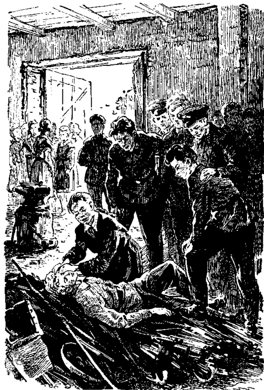
Луна терла мне лоб какой-то медяшкой.

Все засмеялись еще сильнее, и даже девчонки подошли к нам. А Нецветайло покраснел и протянул: